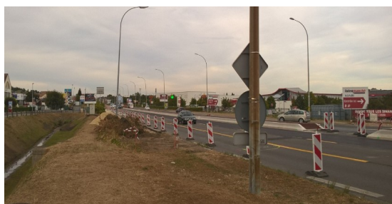
Secteur coté La Ville du Bois