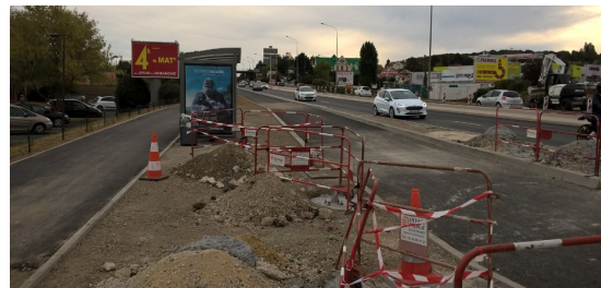
Secteur coté Montlhéry